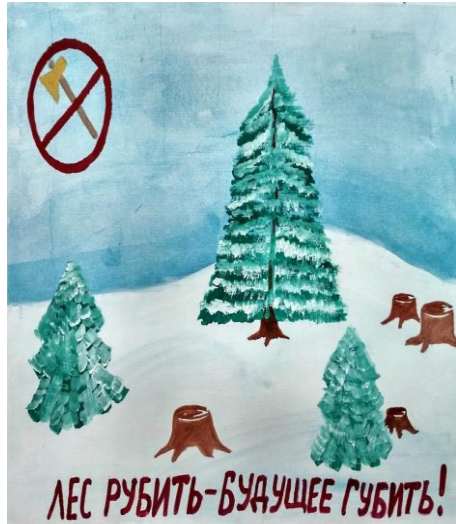
Акция «Здоровый лес-здоровые люди» (март)