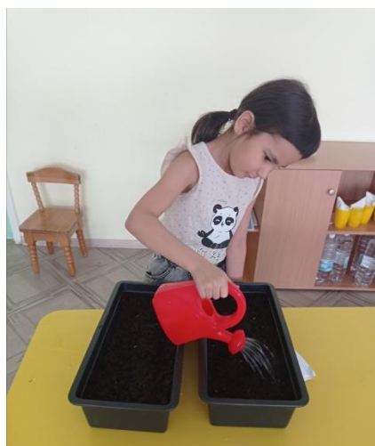
Мини музей «Природа родного края» (май)