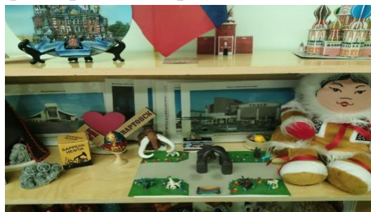
Дидактические игры по экологии